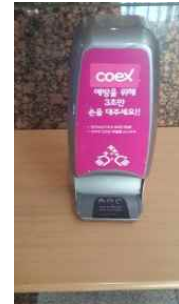
【 손소독기 】